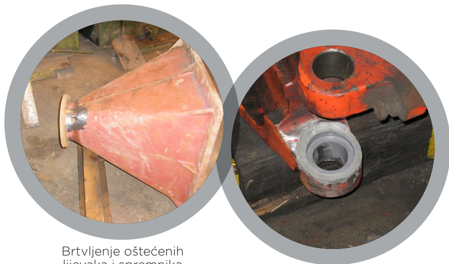
Brtvljenje oštećenih lijevaka i spremnika